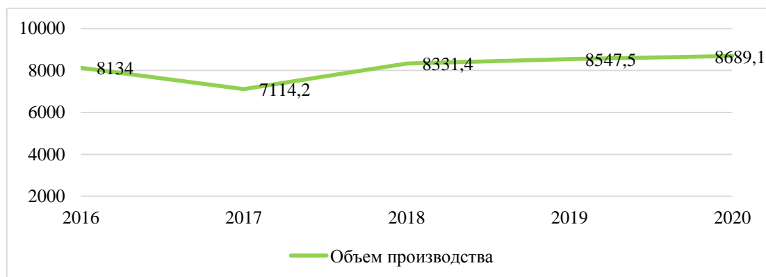
Рис. 1. Общий объем производства пищевых продуктов Республики Саха (Якутия) за 2016-2020 гг.

На рисунке 1 представлен общий объем производства пищевых продуктов Республики Саха (Якутия) за 2016-2020 гг.